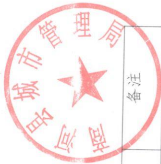
商丘县 2020 年 07 月 餐厨废弃物收运管理考核表