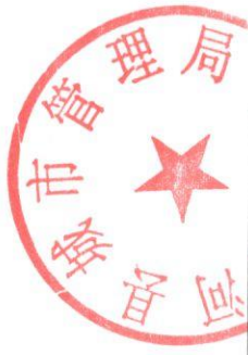
商河县2020年10月餐厨废弃物收运管理考核表