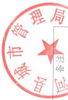
商河县 2020 年 11 月 餐厨废弃物收运管理考核表